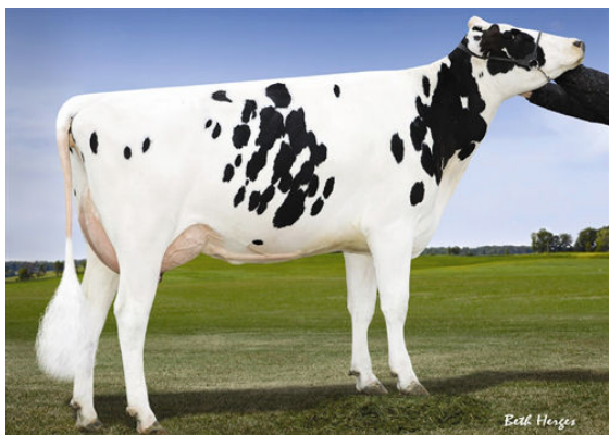
REGANCREST DORCY BENISHEY